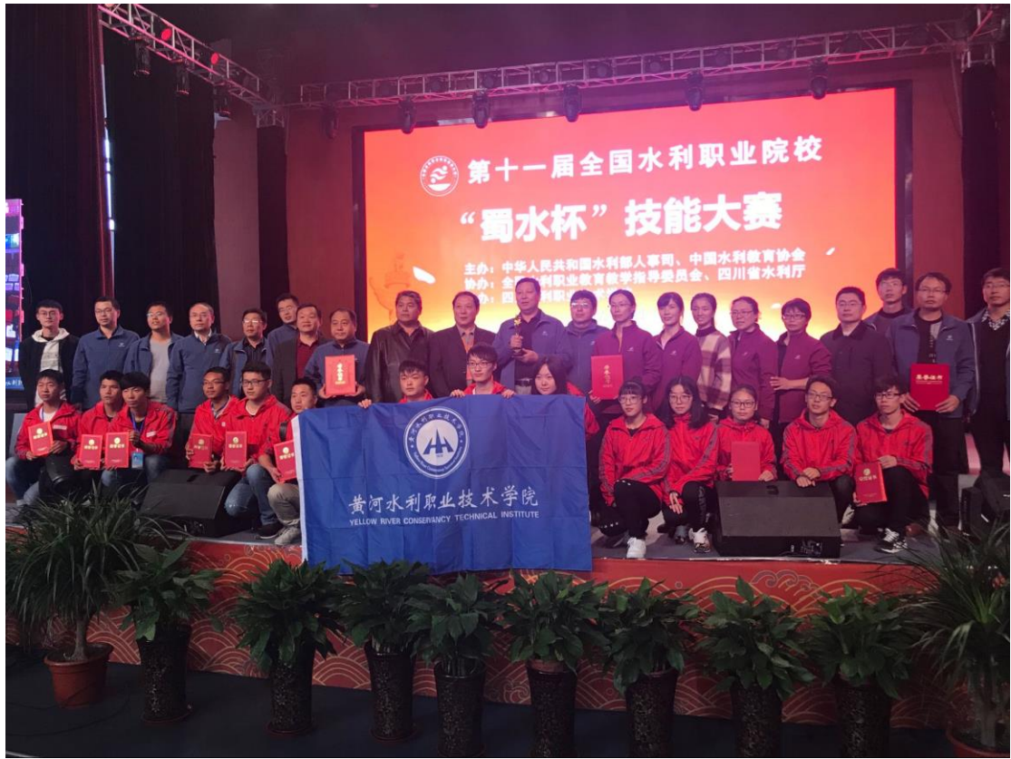
地下与隧道工程技术专业学生获得全国土工竞赛一等奖