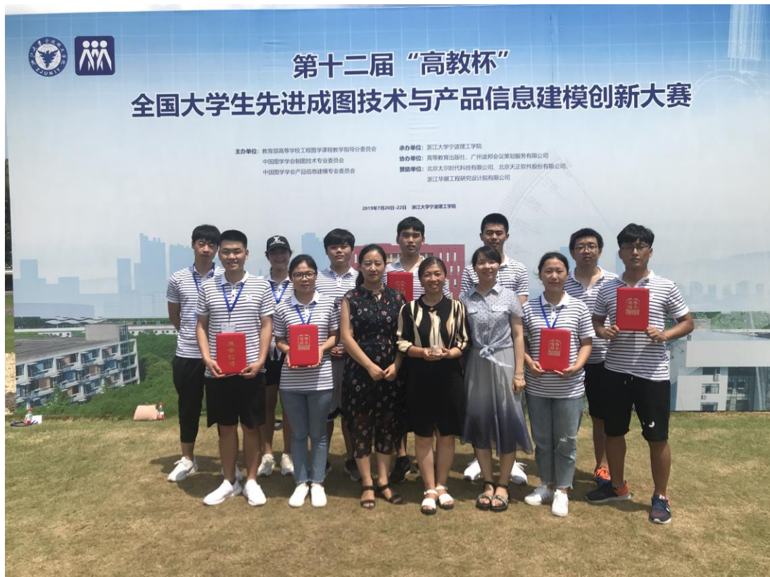
道路与桥梁工程专业全国识图大赛团体一等奖

培养目标： 本专业培养德、智、体、美、劳全面发展，具有良好职业道德和人文素养，掌握道路桥梁施工、检测的基本知识，具备道路桥梁施工与管理能力，从事道桥工程施工、检测、造价、公路工程监理、桥隧检测等工作的高素质技术技能人才。