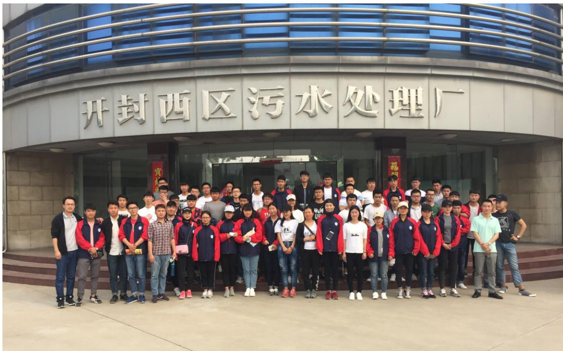
给排水工程技术专业校外认识实习

培养目标： 本专业培养德、智、体、美、劳全面发展，具有良好职业道德和人文素养，从事城镇给水排水、环境保护、污水处理等工程的施工安装、运行管理、工程监理及中小型工程规划设计等工作的高级技术应用性专门人才。