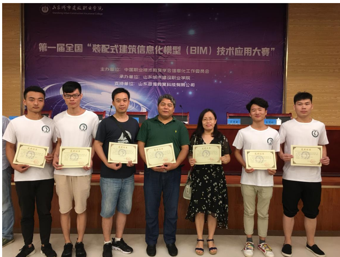
建筑工程技术专业学生获得装配式建筑 BIM 应用大赛一等奖