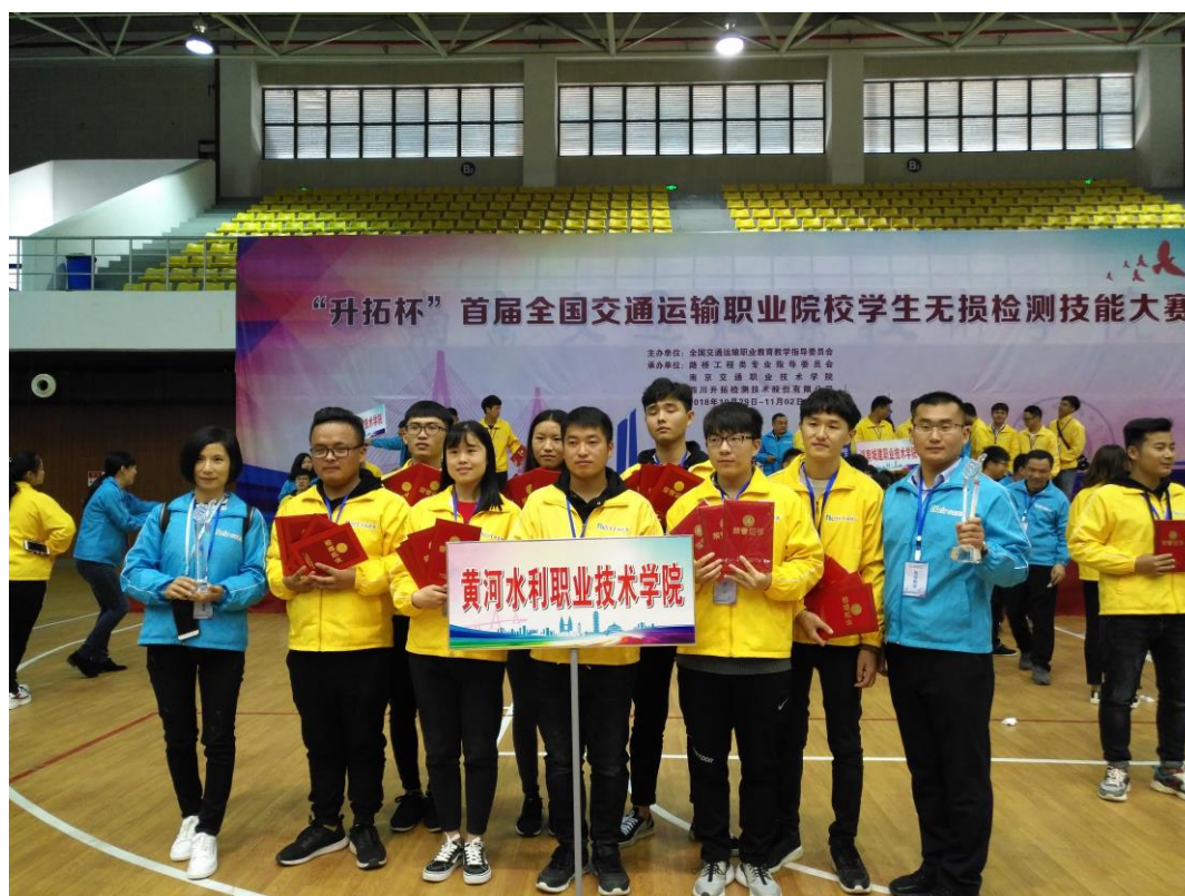
土木工程检测技术专业学生获得“无损检测”全国团体一等奖

培养目标： 培养具有良好职业道德和身体素质、必备的基础理论知识，掌握土建工程材料实验和工程质量检测原理，能够在现场进行各类材料构件的实验检测工作，具有一定的实验与检测、施工测量、施工图识读、施工质量控制能力的高等技术应用性人才。