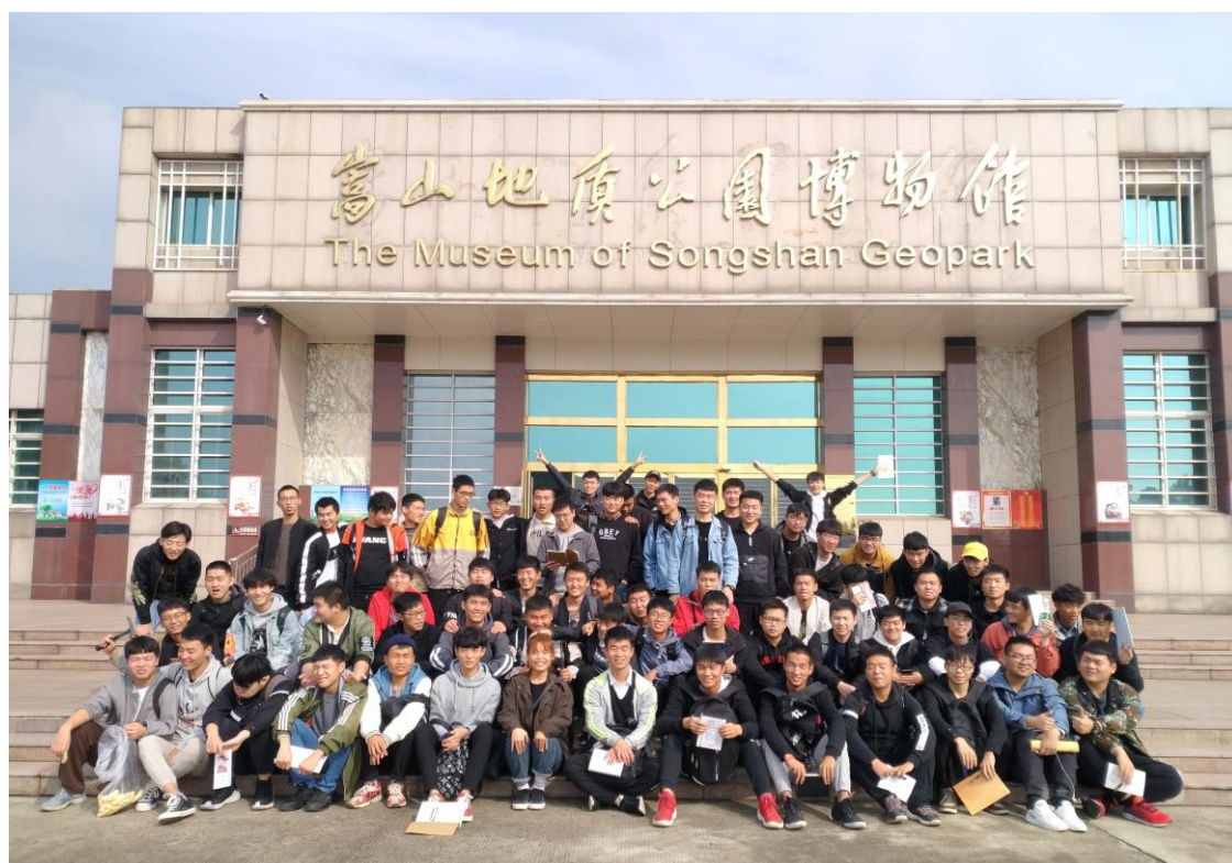
地下与隧道工程技术专业外出地质实习

培养目标： 面向建筑、铁路与公路、矿山、水利水电工程以及城市地下工程等行业，培养从事地下工程及隧道工程的施工、管理、检测等工作的高技能人才。培养掌握地下工程与隧道工程的基本理论和知识，具备岗位职业能力，从事地下工程与隧道工程生产一线技术与管理工作的高级技术应用性专门人才。