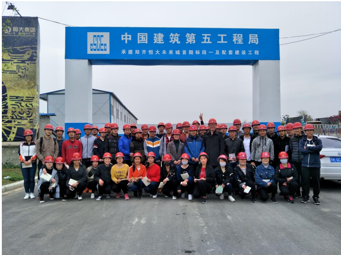
工程造价专业学生赴中建五局认识实习