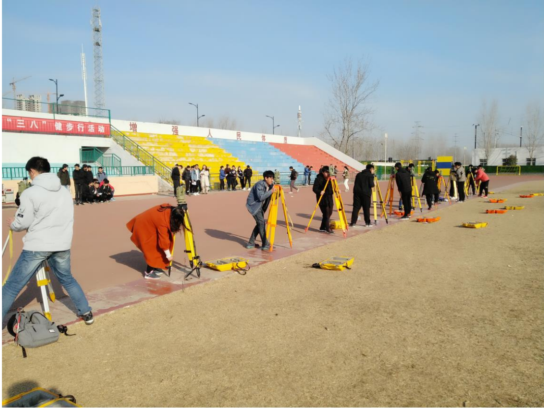
道路与桥梁工程技术专业道路勘测与放样实训