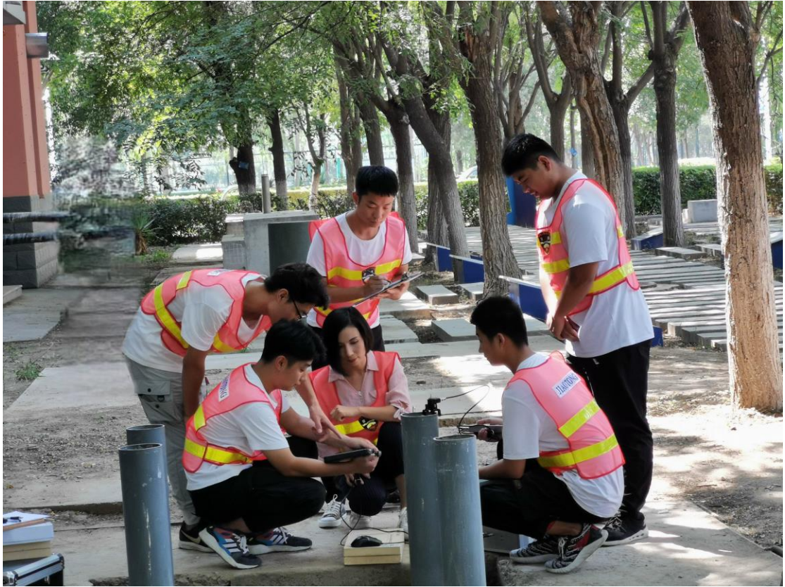
土木工程检测技术专业学生进行校内无损检测实训