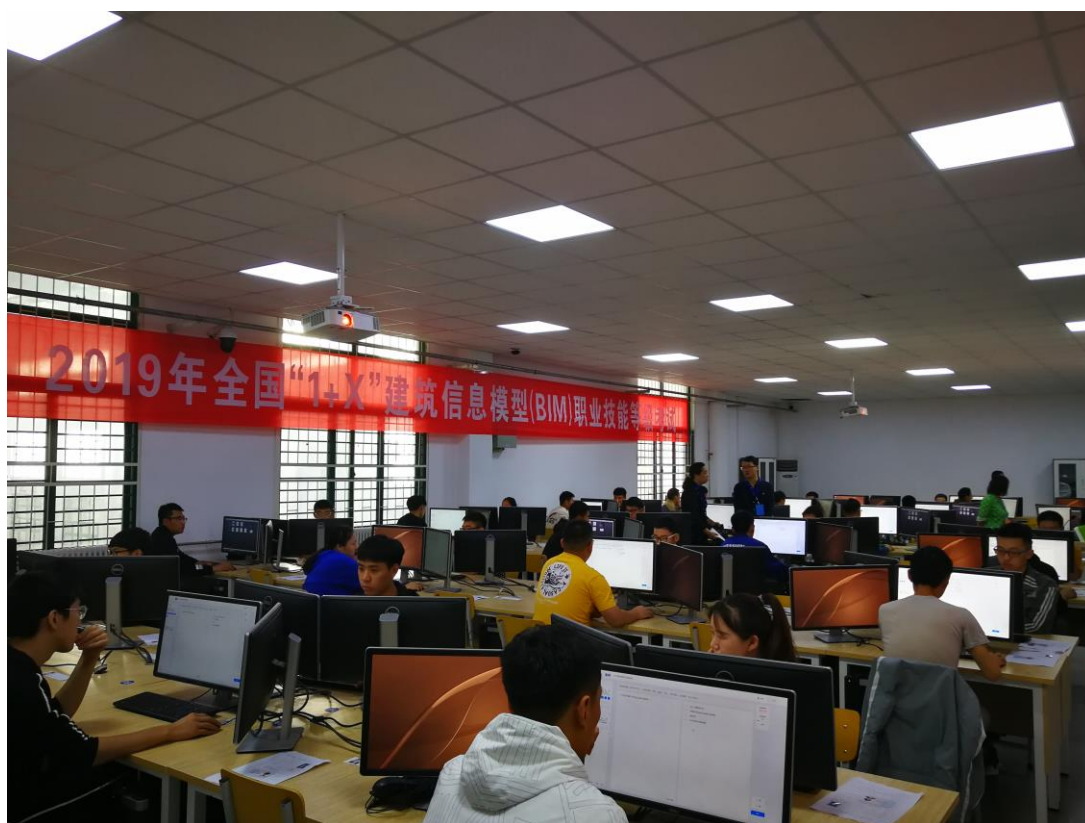
建筑工程技术专业入选教育部首批 1+X 证书制度试点