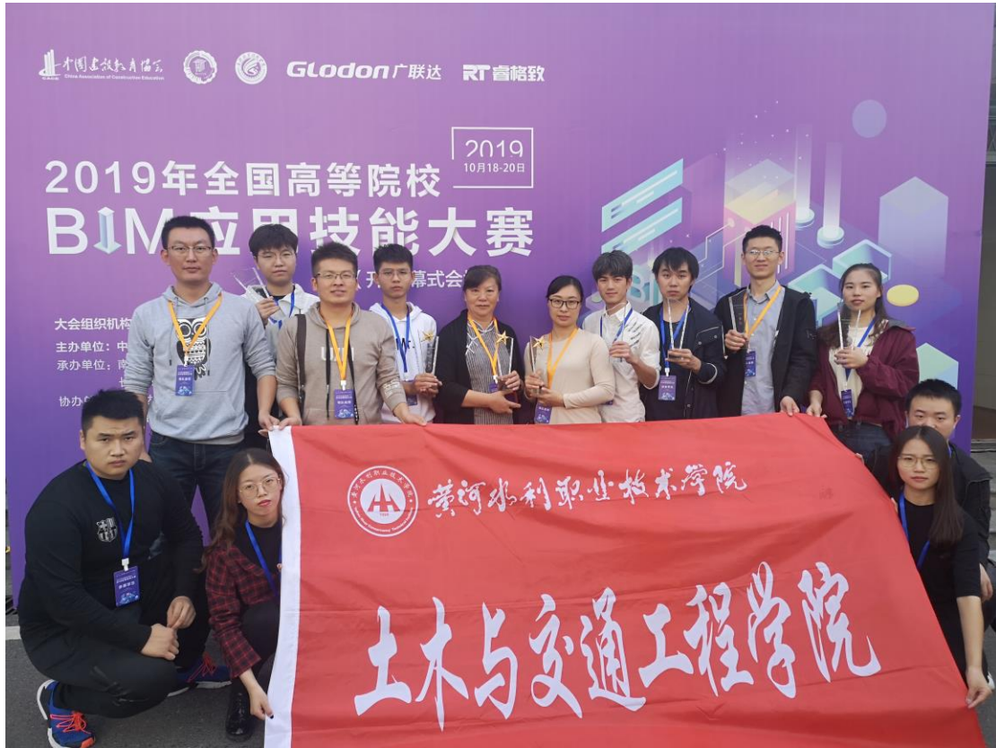
工程造价专业获得全国高等院校 BIM 应用技能大赛一等奖