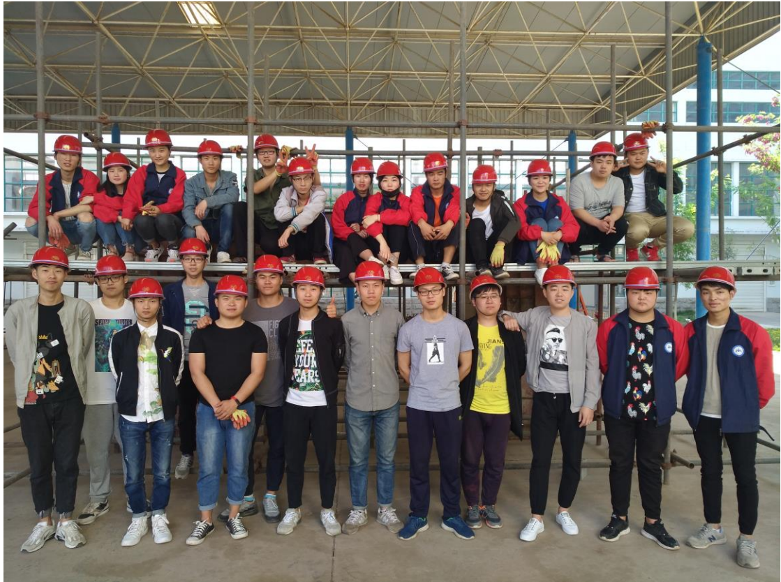
建筑工程技术（建筑工程质量与安全管理）学生模板实训合影